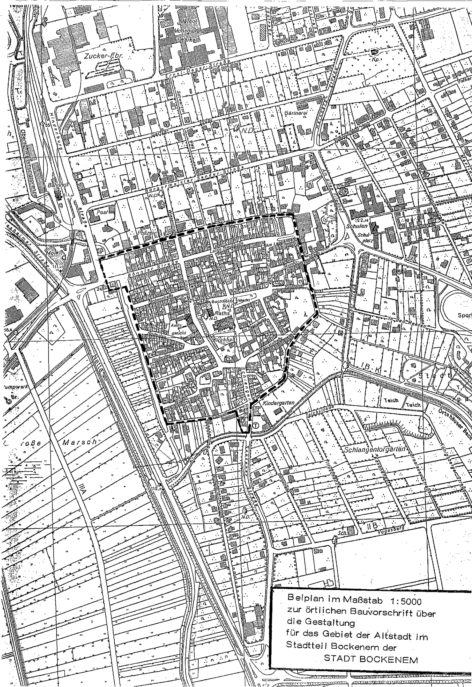
Beiplan im Maßstab 1:5000 zur örtlichen Bauvorschrift über die Gestaltung für das Gebiet der Altstadt im Stadtteil Bockenem der STADT BOCKENEM